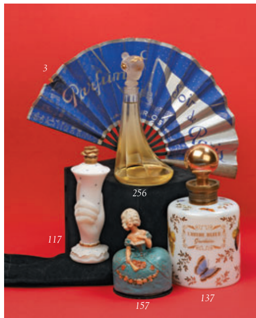
Sur la couverture.